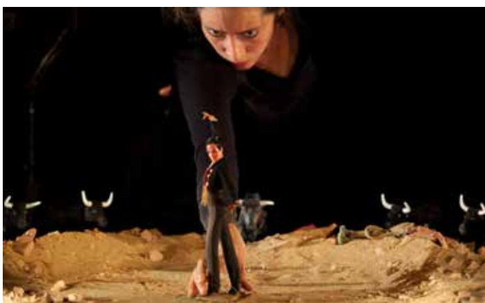
© Yves Gabriel / Province de Liège

La trahison, la vengeance, l'obscurité, la beauté fatale.